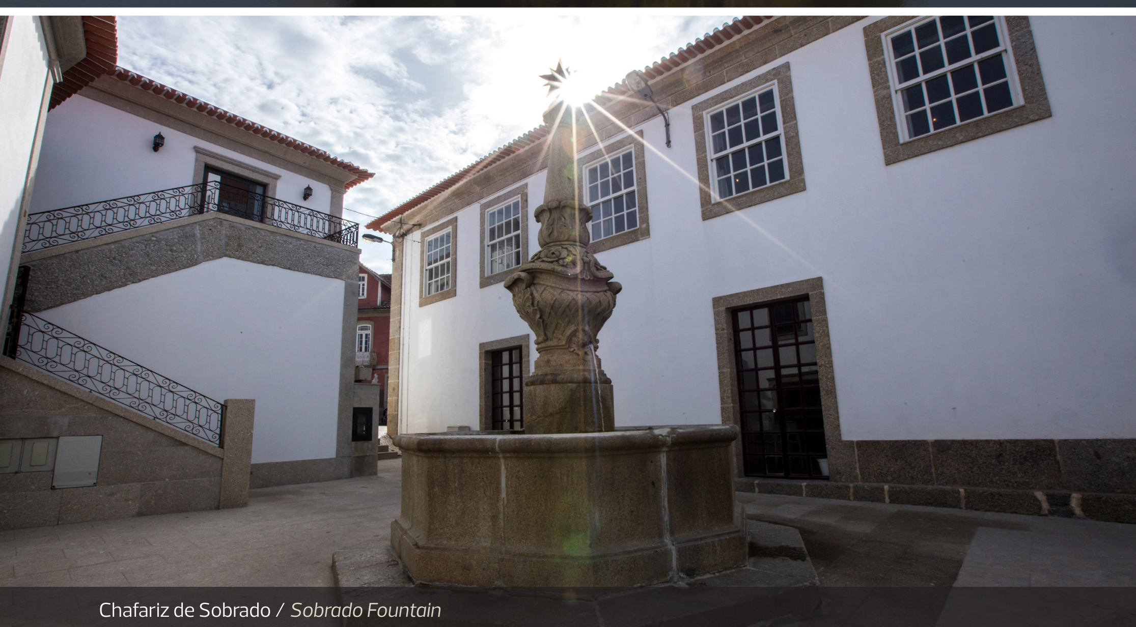
Chafariz de Sobrado / Sobrado Fountain