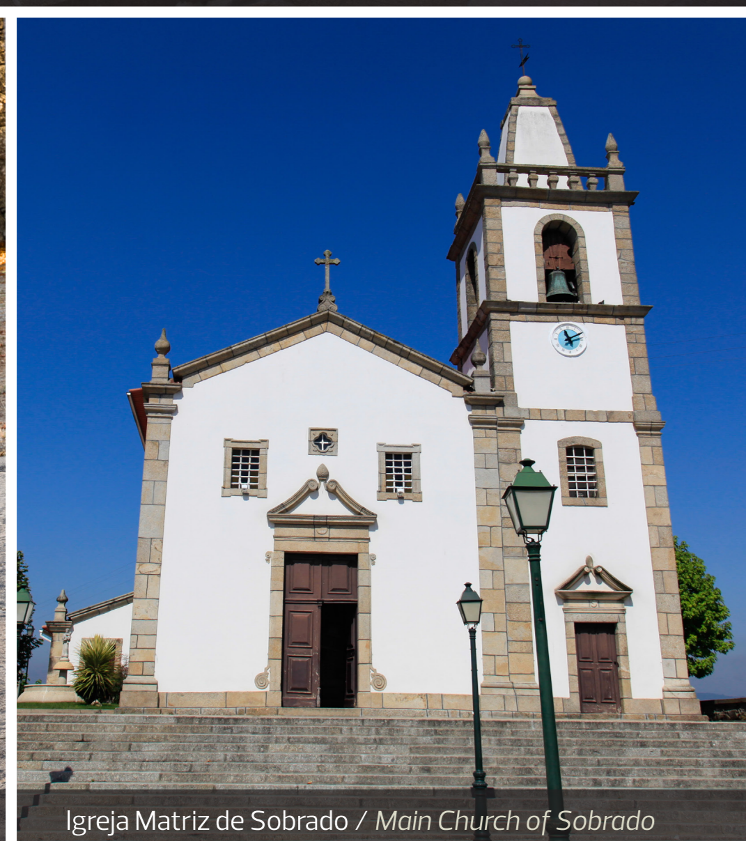
Igreja Matriz de Sobrado / Main Church of Sobrado