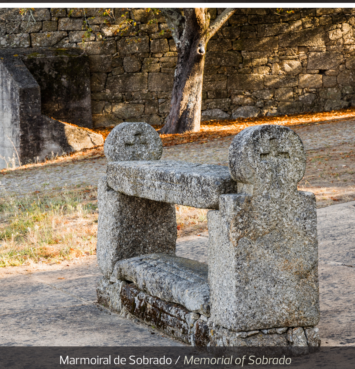
Marmoiral de Sobrado / Memorial of Sobrado