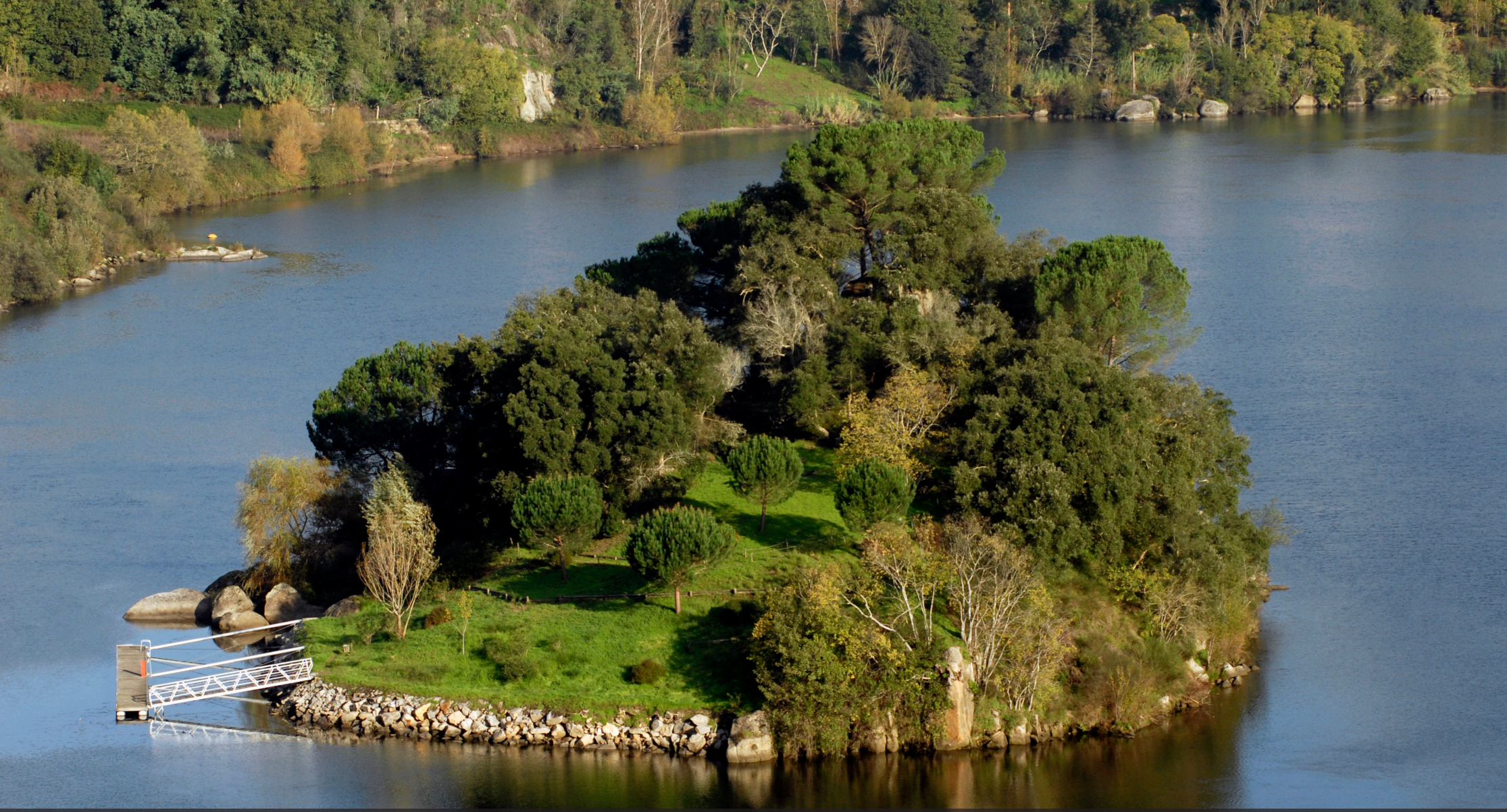
Ilha dos Amores / Isle of Loves